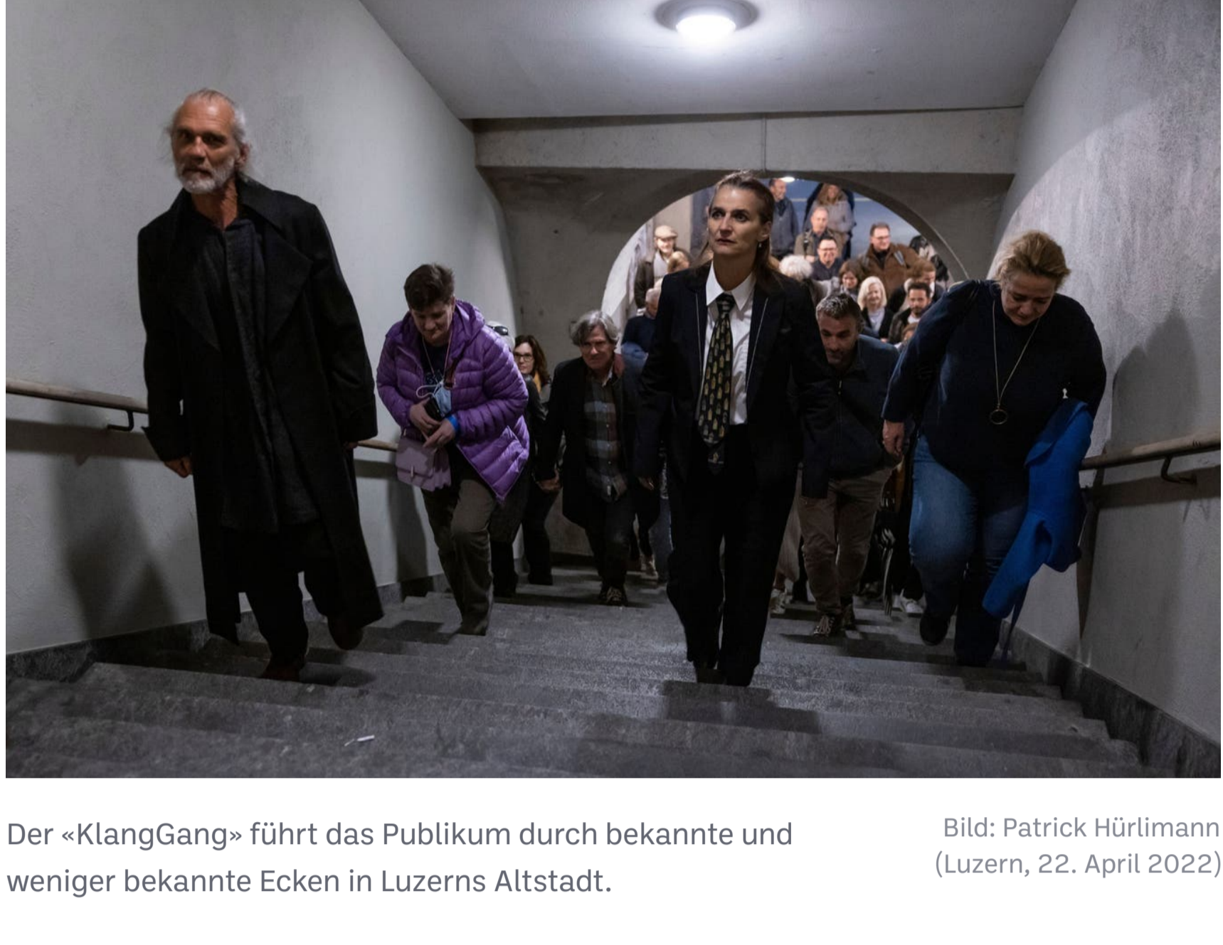
Der «KlangGang» führt das Publikum durch bekannte und weniger bekannte Ecken in Luzerns Altstadt.